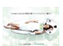
タカラベルモント