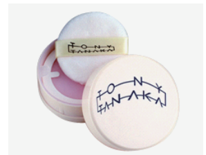
フェイスパウダー カラレス サロン価 ¥3,150